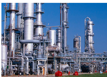
Bayernoil Raffineriegesellschaft mbH

Bayernoil ist ein traditionsreiches Raffinerie-Unternehmen im Herzen Bayerns, welches aus Rohöl die verschiedensten Produkte wie Benzin, Diesel, Heizöl und Bitumen herstellt.