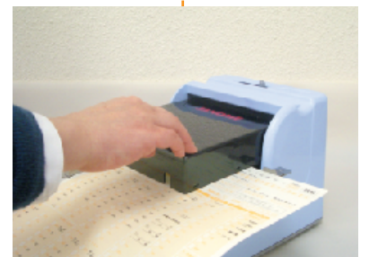
■ 二重印字防止機構付