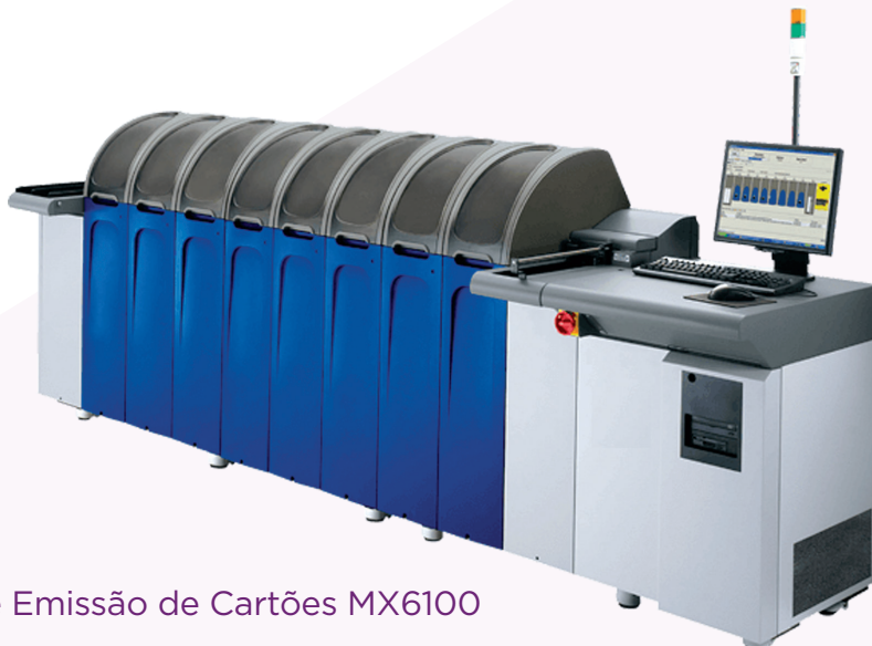
Sistema de Emissão de Cartões MX6100

Serviço e suporte: Os Sistemas da Série MX são suportados pela maior rede de serviços e suporte da indústria, que abrange mais de 150 países em todo o mundo. O suporte on-line e por telefone está disponível 24 horas por dia, 7 dias por semana.