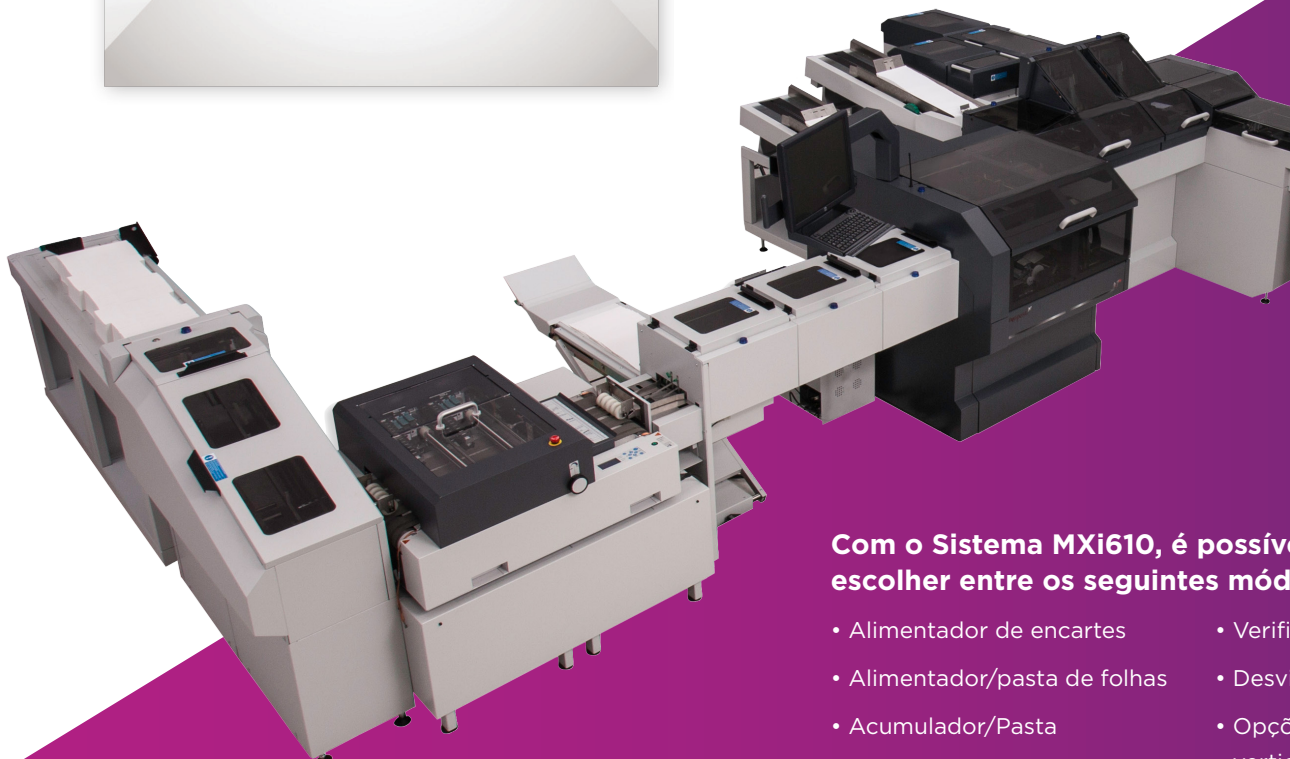
Sistema de Inserção de Envelope MXi610