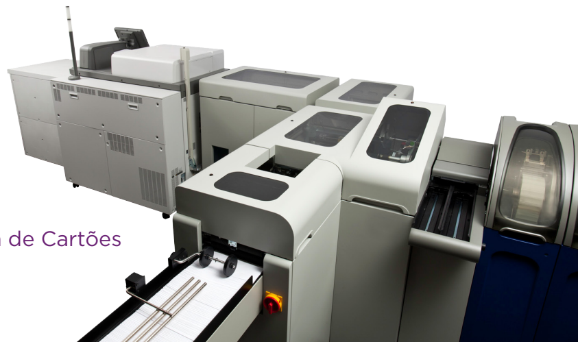
Sistema de Entrega de Cartões MXD610

Compatível com as tendências do mercado: Atenda à crescente tendência de cartões verticais sem limitar os tamanhos de trabalho com base na orientação do cartão. Colocar dinamicamente os cartões nos transportadores horizontal e verticalmente para atender às solicitações dos clientes.