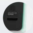
操作パネル周囲のLEDは 緑色にも変更できます。 また、現金や用紙が残り 少なくなると点滅します。