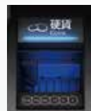
取り出しやすい 硬貨投入・返却口

日本語、英語、中国語（繁体字・簡体字）、韓国語の4ヶ国語でガイダンスを表示し、増加する外国人患者さんにもスムーズにご利用いただけます。